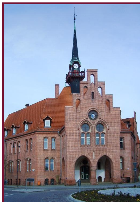
Rathaus Nauen (1901 und heute)